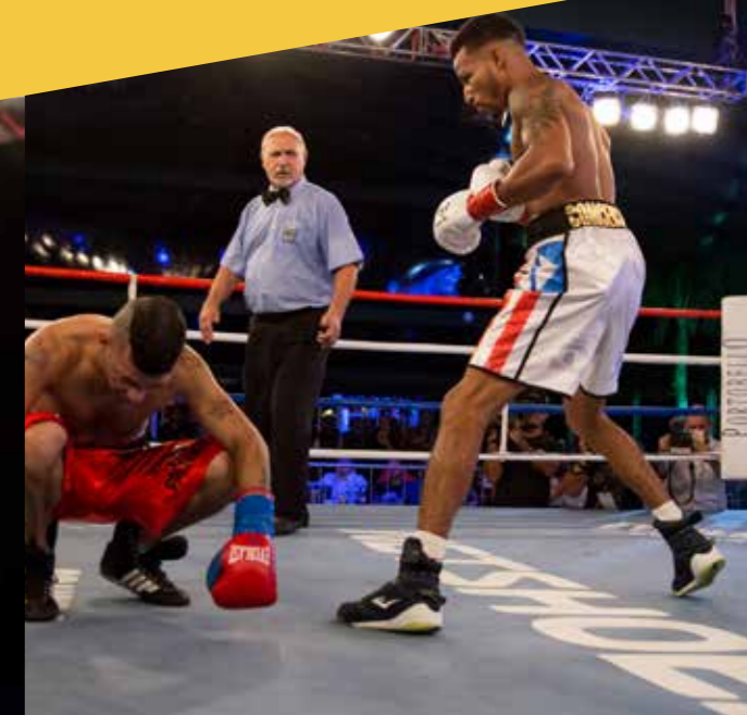
ESQUIVA FALCÃO E ROBSON CONCEIÇÃO BRILHARAM NO BOXING FOR YOU #5